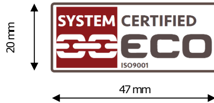
Figura 1 – Marchio ECO per Organizzazioni con Sistema di Gestione certificato secondo la norma ISO 9001