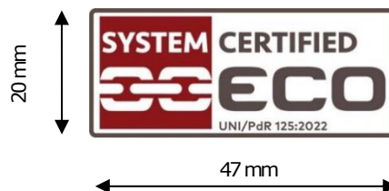
Figura 3 – Marchio ECO per Organizzazioni con sistema di gestione per la parità di genere certificato ai sensi della UNI/PdR 125:2022

Il font utilizzato è corpo 9, grassetto.